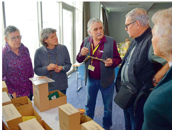
Im direkten Gespräch können Pflanzenschutzprobleme zumeist besser erörtert werden als online am Computer.