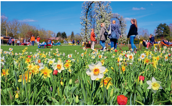
Die LaGa 2022 in Beelitz hat alle Erwartungen übertroffen und zieht eine positive Zwischenbilanz.