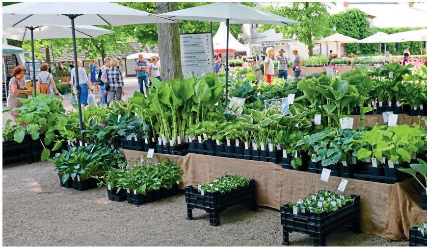
Regionale Produzenten werden bei der Gartenmesse in Hoppegarten ihr ganzes Spektrum an Pflanzenzüchtungen und auch so manche Rarität präsentieren.

Klimaschonendes Gärtnern auf großen und kleinen Flächen steht bei den „Gartenträumen“ im Mittelpunkt: Wie kann der Boden mehr Wasser speichern? Welche Pflanzen trotzen sowohl großer Trockenheit als auch heftigen Unwettern? Wo fühlen sich Bienen, Insekten und Nützlinge wirklich wohl? ExpertInnen der grünen Branche geben Tipps mit Aha-Effekt für ökologisches Gärtnern. Pflanzenzüchter bieten ihre Raritäten aus