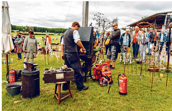
So manchem Handwerker kann man bei der Herstellung von Garteninterieur über die Schulter schauen.

Mit rund 90 AusstellerInnen, Profi-Tipps und Inspirationen, neuesten Trends und einem bunten Rahmenprogramm verwandelt die Gartenmesse das historische Gelände in Hoppegarten für drei Tage in den grünen Treffpunkt für Berlin und Brandenburg. Die Gartenträume bietet allen BesucherInnen so ein ganz eigenes Rennbahn-Erlebnis.