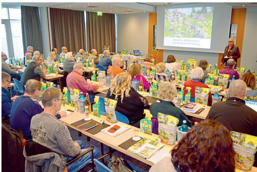
Wechselweise nur noch alle vier Jahre will die Firma Neudorff zu ihren Fachberaterschulungen nach Leipzig (unser Foto), Potsdam, Weimar und Magdeburg einladen.

Vor der Corona-Pandemie haben die Gartenfachberater solche Einladungen der Firma Neudorff zu ihren