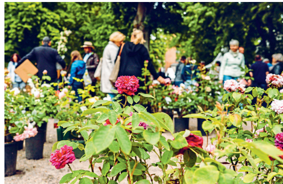
Beim Messebummel können die BesucherInnen aus einer Vielzahl von Pflanzen, Technik und Ausstattung wählen.