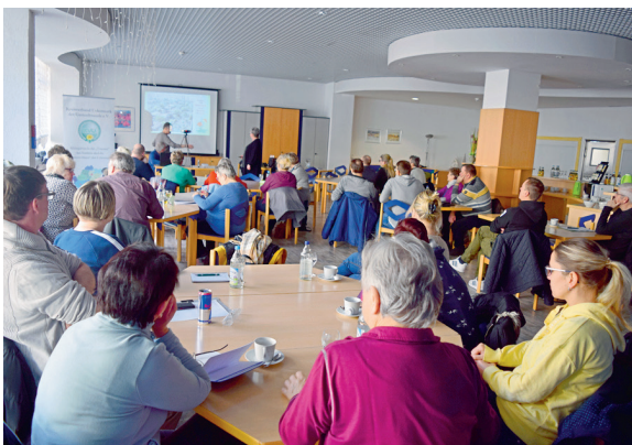
Die Vereinsvertreter kamen im „Haus Harmonie“ der EJV-Heimbetriebs GmbH in Schwedt zusammen.