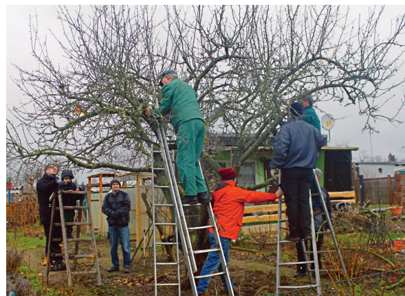
Diese Obstbäume im KGV „Zur Erholung“ Lübben hatten einen Baumschnitt bitter nötig.