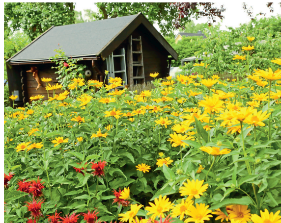
Seit 40 Jahren sorgt das Bundeskleingartengesetz dafür, dass die Blütenräume der Kleingärtner in Erfüllung gehen.

und Vereinen erfüllen ihre Zwecke und sind letztendlich zum Vorteil aller. Etwa 13.500 gemeinnützige Kleingärtnervereine, 500 Stadt-, Kreis-, Bezirks- und Regionalverbände und 20 Landesverbände sorgen dafür, dass Kleingartenanlagen dauerhafter Teil des öffentlichen Grünflächensystems sind. Sie geben der kleingärtnernden Gemeinschaft das gute Gefühl, in ihren Kleingärten einen sicheren Ort von dauerhaftem Bestand gefunden zu haben, in denen sich der Mensch frei fühlen und die Vorzüge eines der beliebtesten Hobbies bundesweit vollends genießen und ausleben kann. So wird mit sehr viel Engagement und Herzblut in hunderten Kleingärten Obst und Gemüse aller Couleur angebaut, um sich selbst zu versorgen. Der Schutz des BKleingG ermöglicht es zudem, dass die große Kleingartengemeinschaft auf über 44.000 ha Landesfläche in den Städten und auf dem Land einen dauerhaften Beitrag zu Klimaresilienz und Biodiversität leisten kann. Letztendlich trägt jeder einzelne dazu bei, dass Kleingärten in unseren Städten und Gemeinden trotz zunehmender Flächennutzungskonkurrenz bewahrt werden und in ihrem Bestand erhalten bleiben. Nutzen und genießen Sie also die Freiheiten, die Ihnen das Bundeskleingartengesetz seit über 40 Jahren bietet.