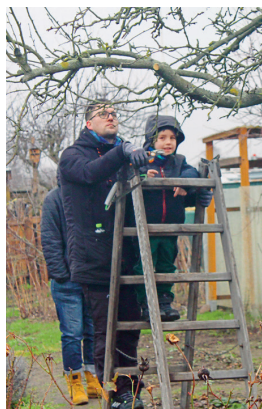
Auch die jüngsten Teilnehmer trauten sich, zu Säge und Astschere zu greifen.